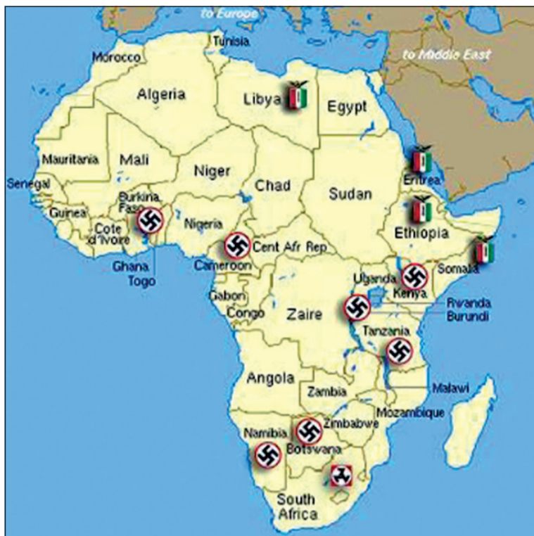
Восстановление и распространение немецких и итальянских расовых колоний в Африке согласно предполагаемому плану тысячелетнего рейха

Это зло могло бы не вызывать практического беспокойства, однако только до победы Германской империи. Скорее всего после такой победы и после нацистского передела мира Гитлер провел бы в Берлине конференцию, на которой потребовал бы от Франции, Великобритании и Бельгии возврата всех германских колоний, которые страна утратила в результате Первой мировой войны, а также серьезных колониальных «исправлений». Нельзя также предполагать, что Гитлер отказался бы от немедленных «исправлений» на колониальной карте, которые он